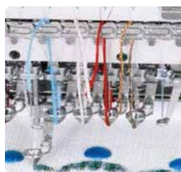
最大6種類のコード素材をセット可能