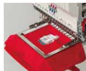
▲エア式クランプ枠