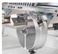
強化ワイド帽子枠