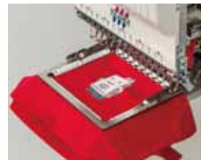
▲エア式クランプ枠