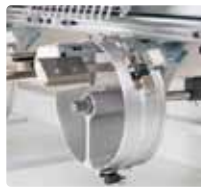
強化ワイド帽子枠